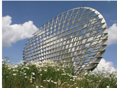
Kunstwerk Rudi van de Wint bij uitvalsweg A37 Hoogeveen

(verlenging tot ondertekening meerjarige prestatieafspraken 2023-2027)